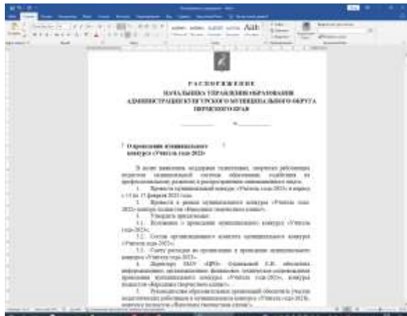
О проведении Конкурса