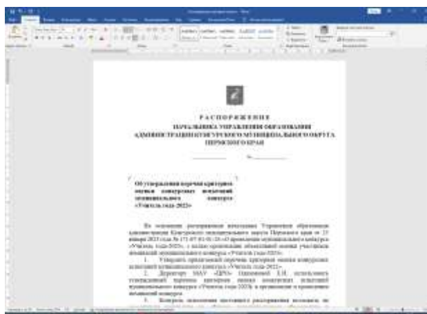
Об утверждении критериев