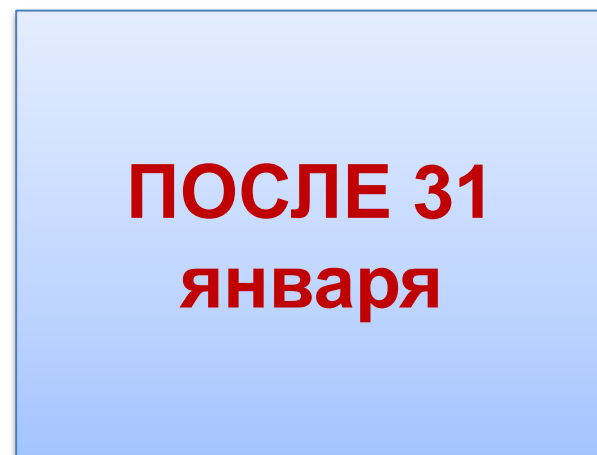
Об утверждении состава жюри