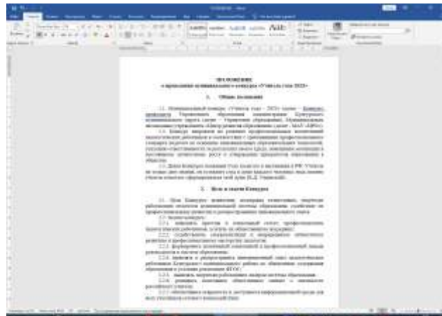
Положение о проведении Конкурса