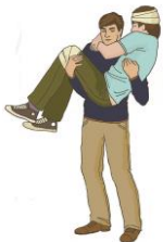
Перемещение в одиночку на руках