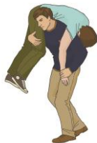
Перемещение в одиночку на плече