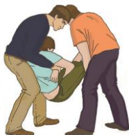
Перемещение вдвоем за руки и ноги