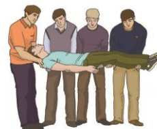
Перемещение с подозрением на травму позвоночника