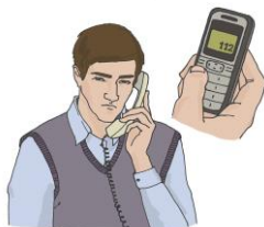
Вызов скорой медицинской помощи