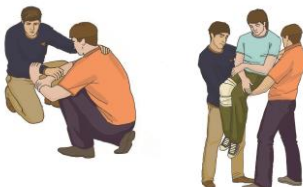
Перемещение вдвоем на замке из трех рук с поддержкой под спину