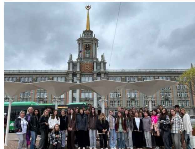
ЭКСКУРСИОННАЯ ПОЕЗДКА ЕКАТЕРИНБУРГ–В.ПЫШМА