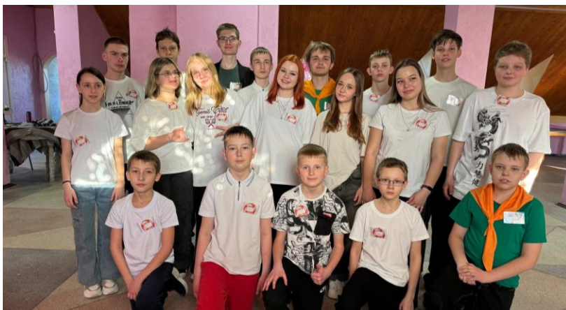
ЗОЛ «Центр Сокол», пос. Усть-Качка с 24 по 30 марта 61 чел.