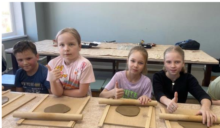
ЛДП на базе образовательных организаций, СШ «Синий кит» 1365 чел.