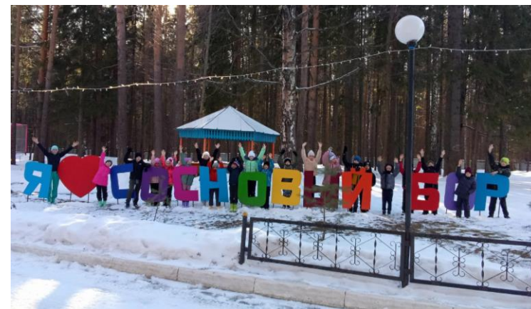
ДОЛ «Сосновый бор» г. Пермь с 22 по 28 марта 47 чел.