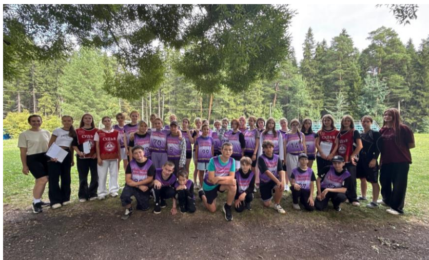
Сдача норм ГТО в ДЗОЛ «Чайка»