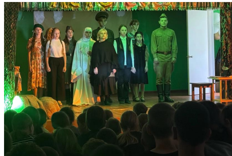
ТЮЗ в ДЗОЛ «Ермак»