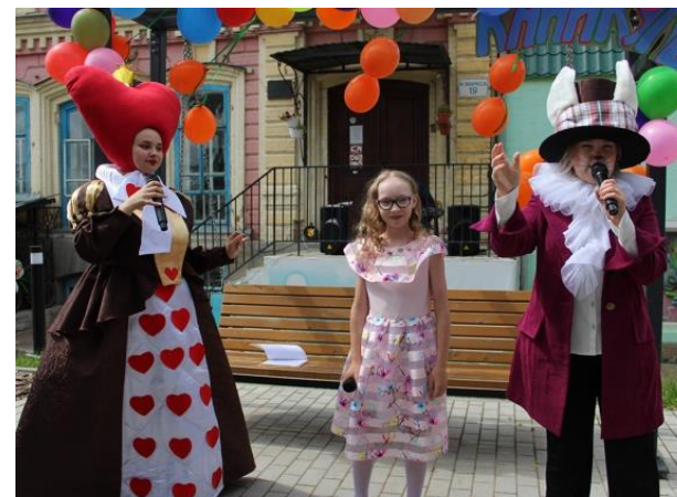
ЛЕТНИЙ СЕМЕЙНЫЙ МАРАФОН «КАНИКУЛЫ. ДЕТИ. КУНГУР»