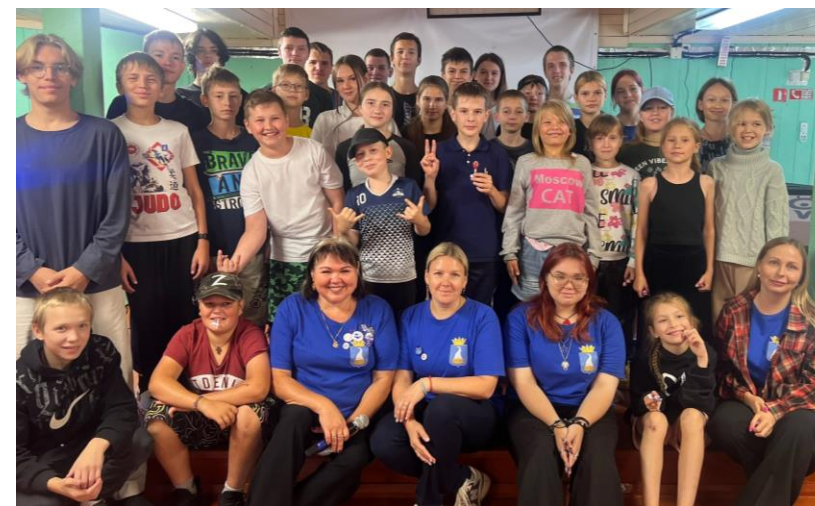
Игра «Я в безопасности» от тренеров профилактики «Команда добра» в ДЗОЛ «Чайка»