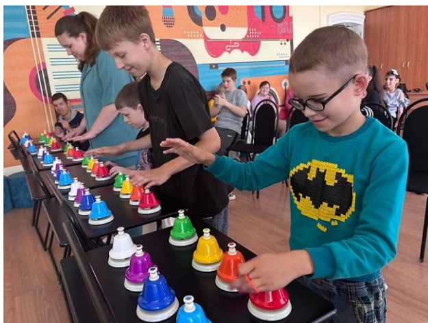
ФОРУМ ДЛЯ ДЕТЕЙ ИНВАЛИДОВ «ЛЕТО НА 5 БАЛЛОВ»