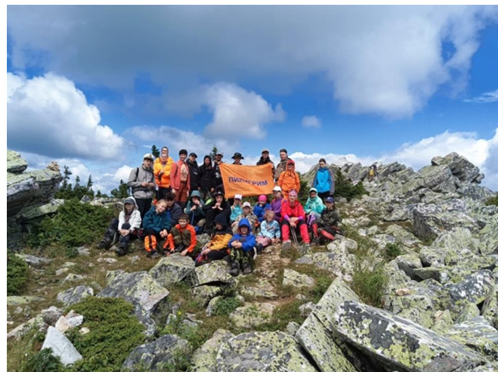
Учебно-тренировочный пеший поход «Дорога-ГЕО-25»