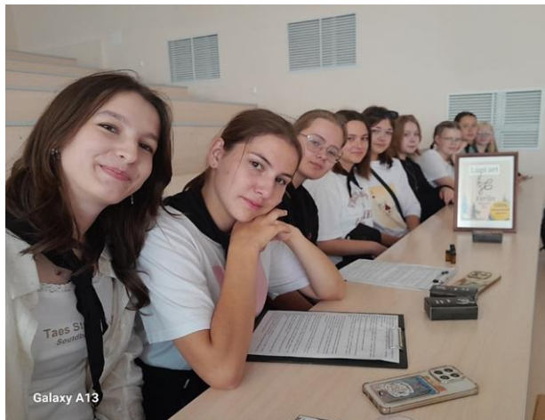
ЛЕТНЯЯ ПРОЕКТНАЯ ШКОЛА «TESTO 4.0»