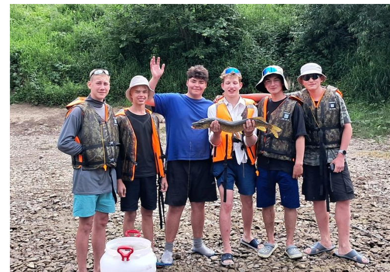
Учебно-тренировочный водный поход «Турист» река Вишера