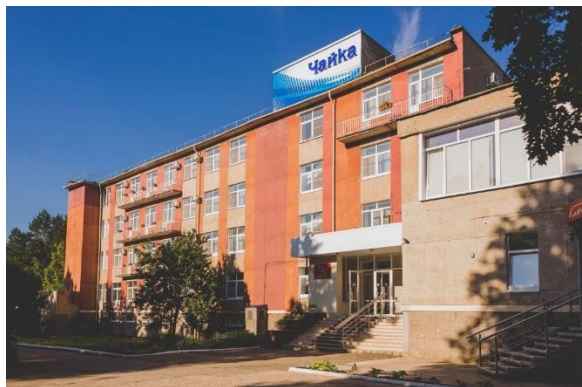
Санаторий-профилакторий «Чайка», г. Чайковский